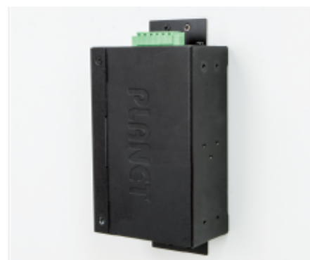
Side Wall Mounting (Space saving)